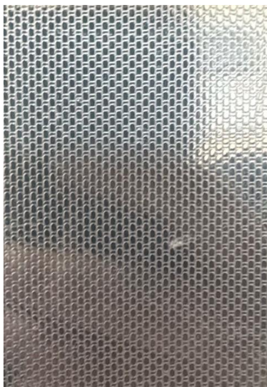
Отделка стен кабины (текстурированная нержавеющая сталь)